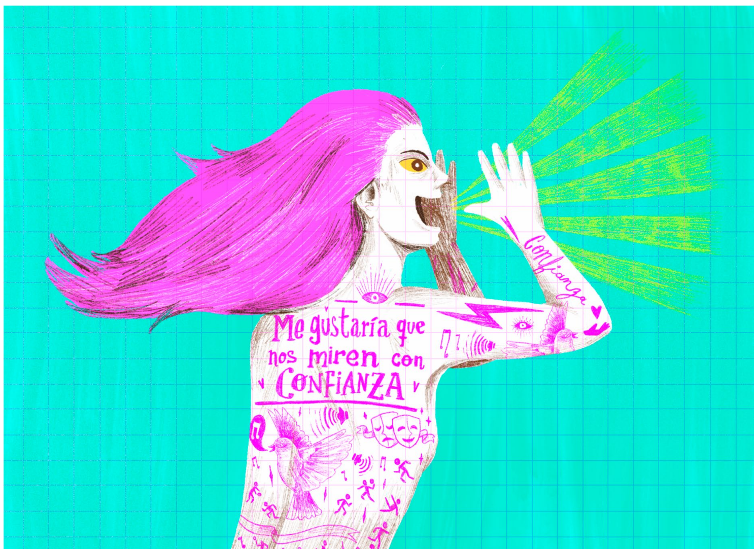
Ilustración de Eduardo Sganga, proyecto “Contanos tu mirada”.

Desde la aprobación de la Ley de Urgente Consideración (LUC) las noticias sobre detención a jóvenes y adolescentes en el espacio público, con el justificativo de disuadir aglomeraciones o establecer el orden, tienen un denominador común: el uso desmedido de las fuerzas represivas. En abril de 2021 un grupo de policías agredió a tres jóvenes mujeres que estaban en una plaza del barrio Cordón en Montevideo, el hecho tuvo características similares a lo ocurrido unos meses antes en la Plaza Seregni de la capital departamental. En febrero de 2022 se viralizó un video donde se puede ver cómo la