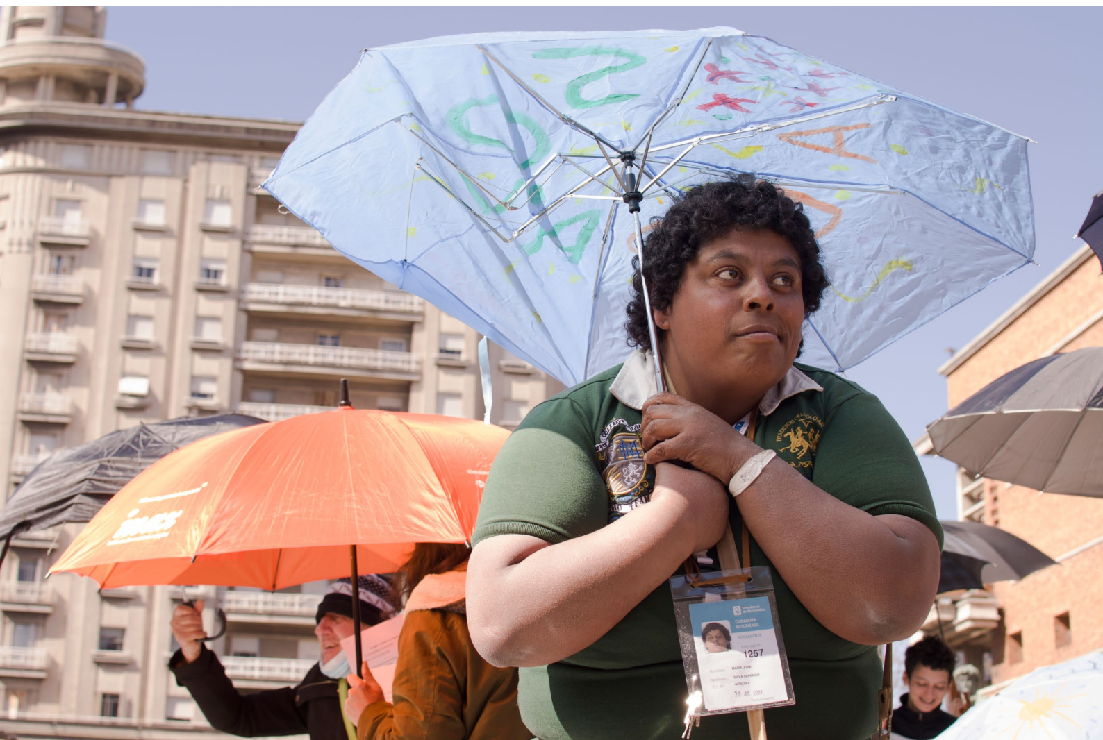
Intervención en explanada de la Intendencia de Montevideo, en el marco del Día de las luchas de las personas en situación de calle. (19/08/2022).

El informe del ente estatal, reconoce que del total de las personas contactadas en Montevideo, el 57,7% fue agredida física o verbalmente estando en situación de calle. En el resto del país la cifra es del 37,1%. En ambos casos, el porcentaje crece a medida que disminuye la edad. La policía, otras personas en situación de calle, y vecinos o transeúntes son los tres grupos de agresores más nombrados.