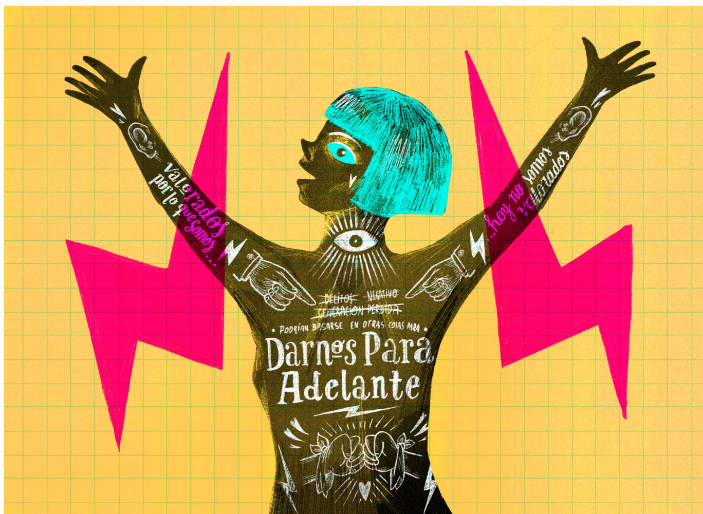
Ilustración de Eduardo Sganga, proyecto “Contanos tu mirada”.

que pretendía ampliar las potestades de la policía y el ejército en el espacio público, y habilitar allanamientos nocturnos -aún sin orden judicial-. A pesar del rechazo a su propuesta en el Plebiscito de 2019, impuso su política punitivista a partir de su asunción como en el Ministerio del Interior el 1 de marzo de 2020. El lema empleado en campaña fue acuñado también como eslogan publicitario de dicho ministerio, incluso hasta tiempo después de la asunción de su sucesor Alberto Heber. También fue usado por agrupaciones a favor posicionadas en contra de la derogación de la LUC en marzo de 2022. Además de las definiciones políticas de insistir en aplicar medidas que poco contribuyen promover prácticas de convivencia para construir comunidades más justas, lo que parece no aflojar es la mirada enjuiciante y esencialista hacia las adolescencias, la criminalización de las adolescencias pobres, y la reproducción de discursos estigmatizantes que distan de las cultura democrática en la que vivimos.