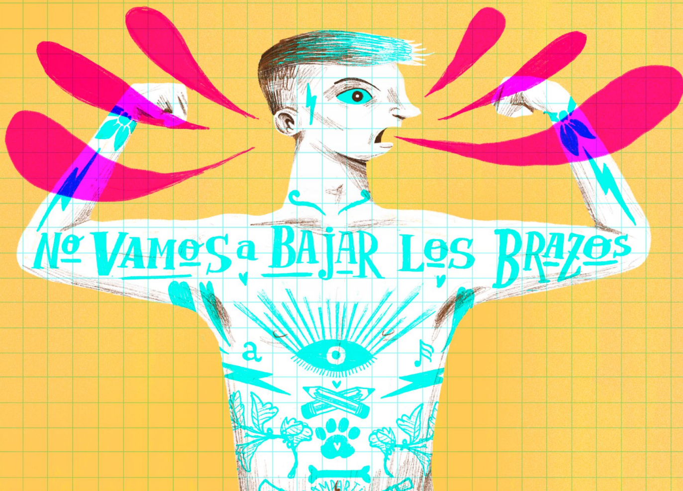
Ilustración de Eduardo Sganga, proyecto "Contanos tu mirada" 4 .

En una sociedad que entre sus prejuicios más arraigados, se encuentra la vinculación de la criminalidad con las juventudes pobres (Fryd, Miranda y Vicci) resulta difícil reflexionar sobre las discursividades de odio sin referirnos a las adolescencias.