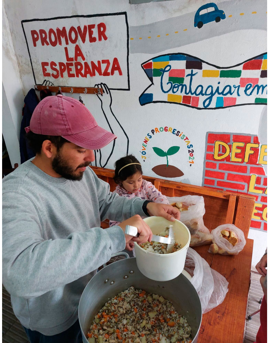
Olla Popular 21 de setiembre - Soriano

ALERTA FEMINISTA veinte femicidios en el año.