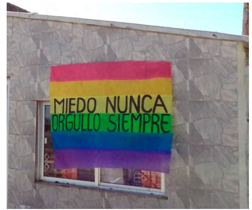
Colectivo Caraguatá

Del encuentro y los intercambios anteriores y posteriores con los colectivos nos quedan las ganas de profundizar en la articulación y el vínculo con organizaciones de otros puntos del país, ese «interior» nombrado de forma homogénea se constituye por ciudades, balnearios, parajes, localidades, y poblados de pocos cientos de personas. Las particularidades de cada espacio no nos son ajenas, pero tampoco obvias. El surf no lo practica solo quien preside el país, hay asentamientos en Maldonado y trata, hay movimiento universitario fuera de Montevideo, en la capital del país hay ruralidad, en gran parte de Uruguay la agenda también la marcan los cursos de agua. Las subjetividades que permean los vínculos comunitarios difieren, mientras que en algunos lugares aparecer en la cobertura fotográfica de una manifestación no signifique un problema, en otros puede tener consecuencias materiales y vinculares difíciles de recomponer.