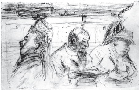
"El Tren" dibujo de Rosa