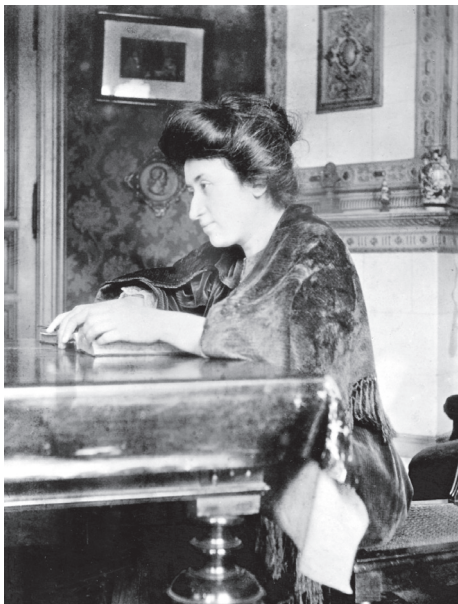
Rosa Luxemburgo, en su hogar en Berlín-Steglitz, 1907.