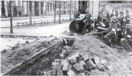
Insurrección espartaquista en Berlín, año 1919.