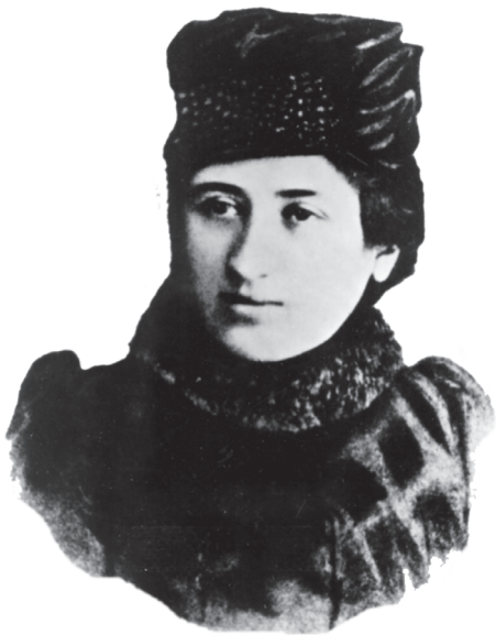
Rosa Luxemburgo, año 1895