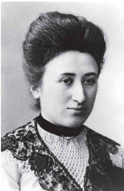
Rosa Luxemburgo, año 1900