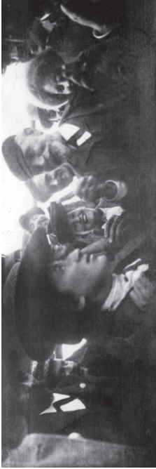
Rosa Luxemburgo, conversando con Augusto Bebel y otros socialdemócratas, 1904.