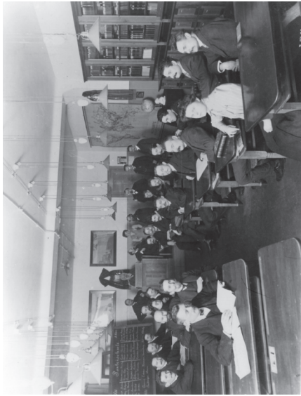
Escuela de militantes