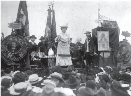
Rosa Luxemburgo, Stuttgart