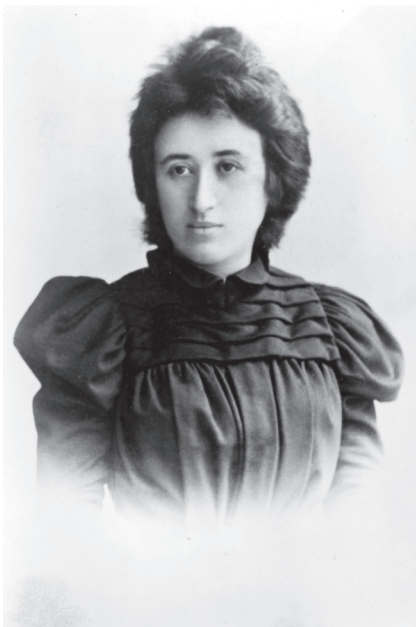
Rosa Luxemburgo, año 1893