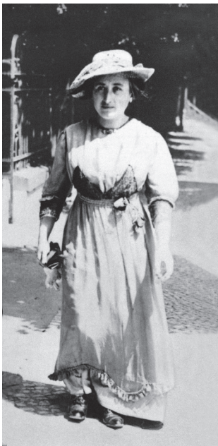
Rosa Luxemburgo, año 1912